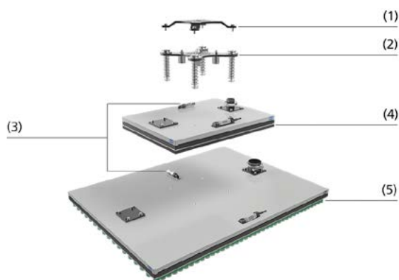
Aufbau Leichtbau-Lagengreifer ZLW

Rechteckige Werkstücke Kartonagen Beutel Zwischenlagen