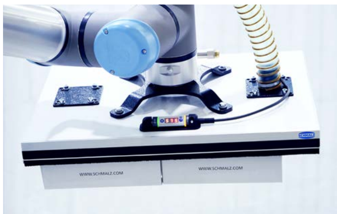
Leichtbau-Lagengreifer ZLW bei der Handhabung von Kartons