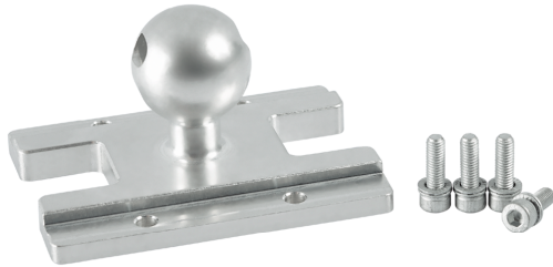
Sistema di fissaggio ventosa magnetica SGM-HP/-HT (multiplo)