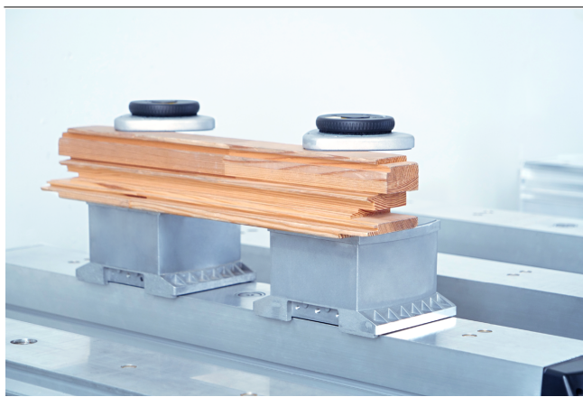
Bloccaggio meccanico VCMC-K2-QUICK per il bloccaggio di parti del telaio