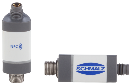
Capteurs de vide et pression VS