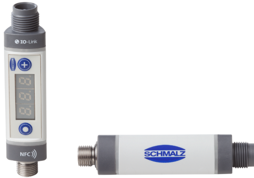
Vacuestatos y presostatos VSi