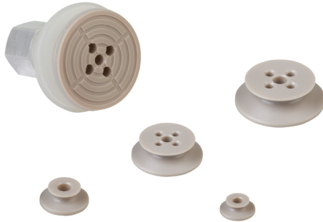
Insertos de ventosa SPI PEEK