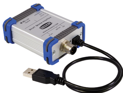
Smart Device Interface SDI