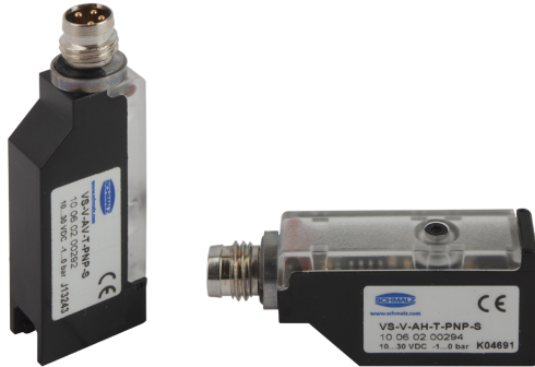
Vacuostati e pressostati VS-V/P-AH/AV-T