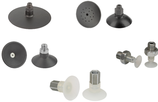
Ventouses plates SGN