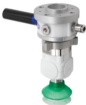
Kits de préhension pour robot VEE