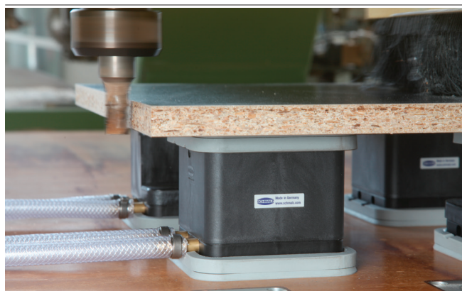
Blocchi di aspirazione VCBL-G durante il bloccaggio di pannelli in truciolato