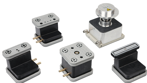
Blocchi di aspirazione VCBL-G