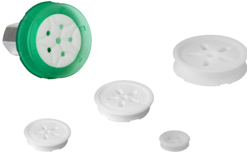
Inserts de ventouse SPI (pour SPB1)