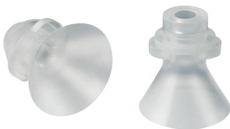
Ventose per cioccolatini SPG