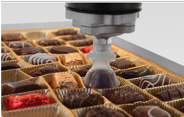
Pralinensauger SPG bei der Handhabung von Pralinen