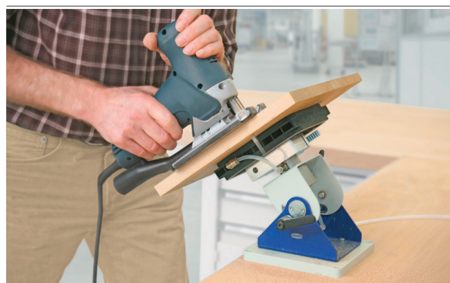
Multi-Clamp VC-M durante la lavorazione manuale di un pezzo di legno