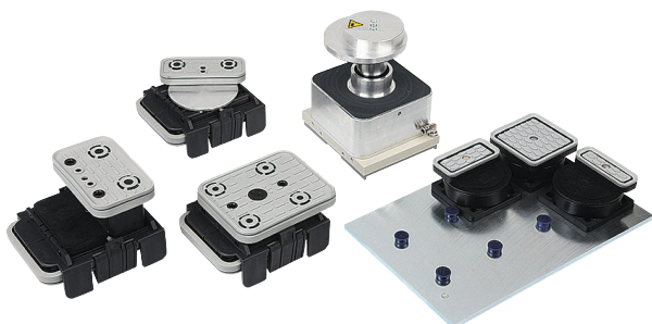
Sistemi di bloccaggio per profili Schmalz (1 circuito)