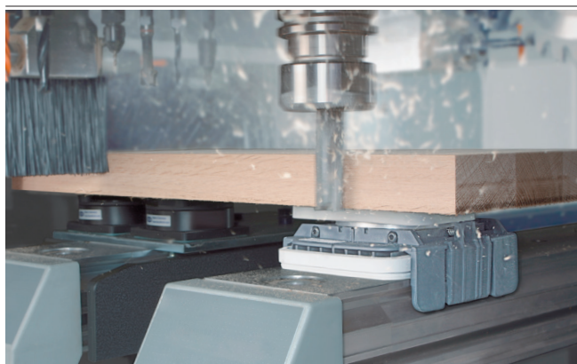
Blocco di aspirazione VCBL-K1 durante il bloccaggio del legno massello

Idonei per applicazioni specifiche del settore