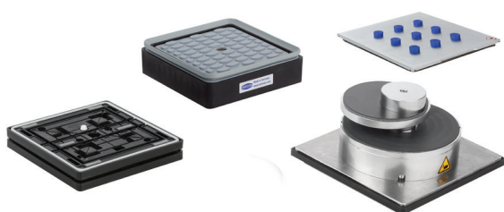
Sistemi di bloccaggio per piani grigliati