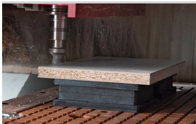
Blocco di aspirazione VCBL-R durante il bloccaggio di pannelli in truciolato