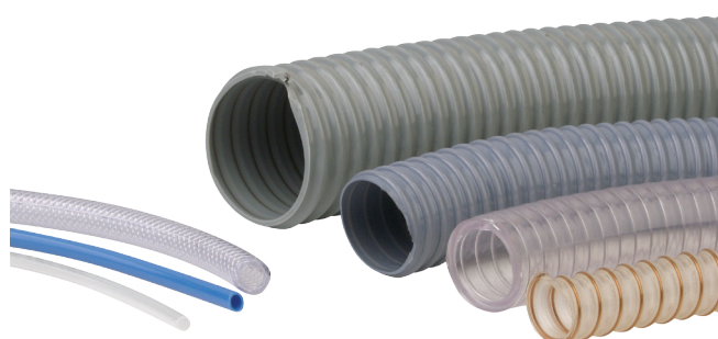
Tuyaux de vide / d'air comprimé VSL