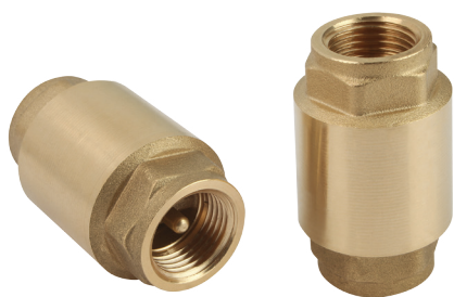
Clapets anti-retour RSV