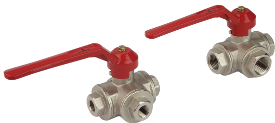
Dreiwege Kugelventile KVD